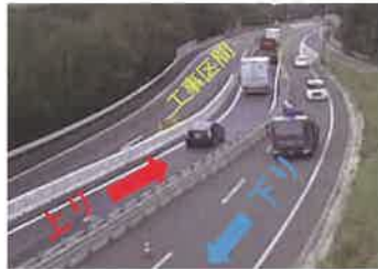
対面通行の様子(令和5年)