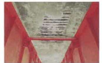
老朽化した床版下面