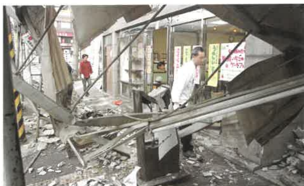
広島市西区 広電 西広島駅付近