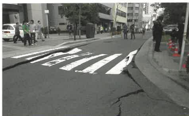
広島市中区 平和大通り付近

Yahoo!防災速報アプリの「防災タイムライン」なら 津波による浸水区域など、自宅の危険度が分かります。