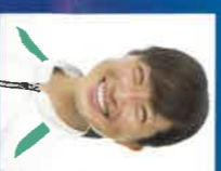
みさと 道下 美里

1977年1月19日生まれ 山口県下関市出身 2004年言学学校在学中に陸上競技と出会い、2008年からフルマラソンに挑戦する。144cmと小柄だが「あきらめない」「拼搏する心」で、次々と各地の大会へ出場。2016年に出場したリオデジャネイロパラリンピックの旗争いがい若女子マラソンで銀メダルを獲得。 2017年防府新発マラソンで世界新記録を樹立。2020年同大会で自身の持つ世界記録をさらに更新し四連覇を達成。 2021年東京2020パラリンピックでは大会新記録で見事金メダルを獲得した。