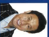
みやもと 宮本 和知

双子の兄・健司とともにルビエツグ複合選手として競歩を現し、1994年からワールドカップに参戦。1995年の世界選手権では団体金メダルを獲得する。 1998年は念願の長野五輪に出場、入賞を果たした。引退後はスホービキヤスターとしてメキシコを移住し、オリーブブランチの代表格のヒビととして、ウエスタン・スホービキヤを担い、2017年には日本オリンピック委員会特別員就任を以て受賞。フロンティア活動の推進がきっかけで富山県(富山県)でサッカーを企画し、日本百名山登頂に挑戦中(2022年8月現在72登頂)。