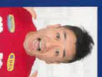
ねこ 猫 ひろし

生年月日:1964年2月13日 山口県下関市出身 略歴:下関工業高校(現下関工業高校)卒業後、川崎製鉄水島製鉄所入社 1984年 ロサンゼルスオリンピック日本代表・金メダル獲得 1985年 読者巨人入賞 3度の同じ投げ投手を経験(89年セ・リーグ日本シリーズ、90年セ・リーグ) 1997年 引退(通算成績66勝62敗セーブ 防壁率3.60) 2008年 山口ふるさと大使 就任 2019年 読者ジャイアンツ 1軍投手総合コーチ 2020年 読者ジャイアンツ 球団社長補佐(フロント) 2022年 読者ジャイアンツ 女子硬式野球チーム・チームフロントバイザー ジャイアンツアカデミー 校長