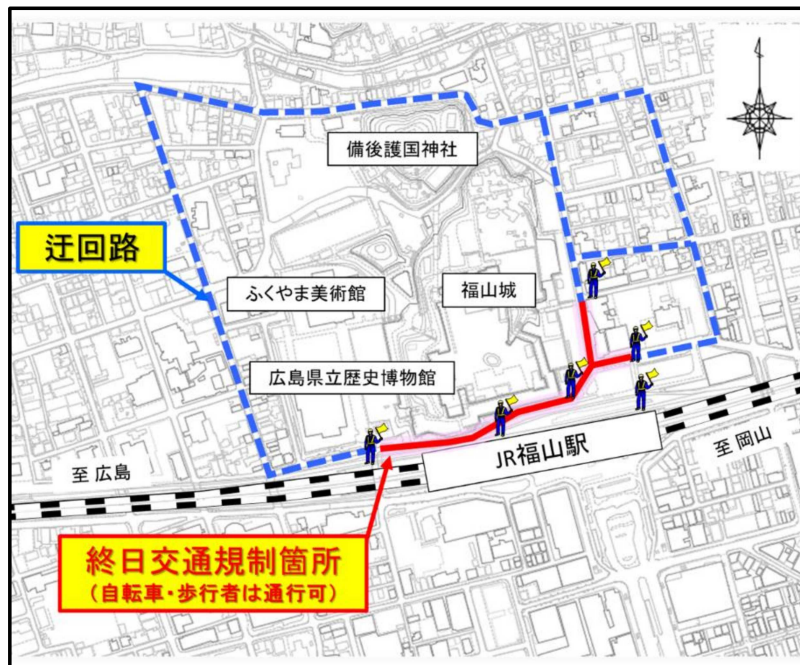
福山駅北口周辺の詳細図