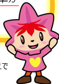
協会けんぽ広島支部 マスケットキャラクター 健康かえで