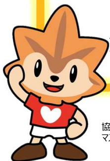
協会けんぽ広島支部 マスケットキャラクター 健康いろは