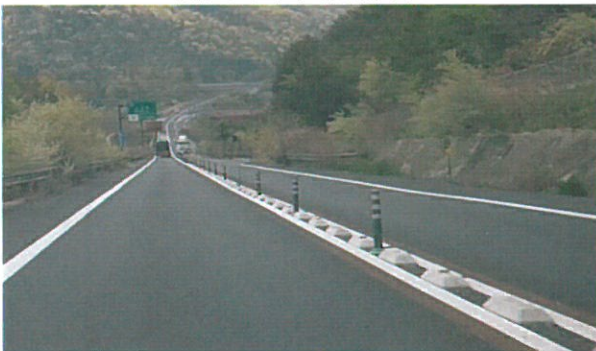
現在の中央分離帯