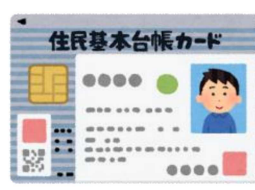
住民基本台帳カード