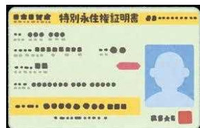
特別永住権証明書