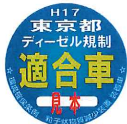
九都県市指定 粒子状物質減少装置ステッカー