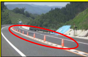
極太ポストコーン