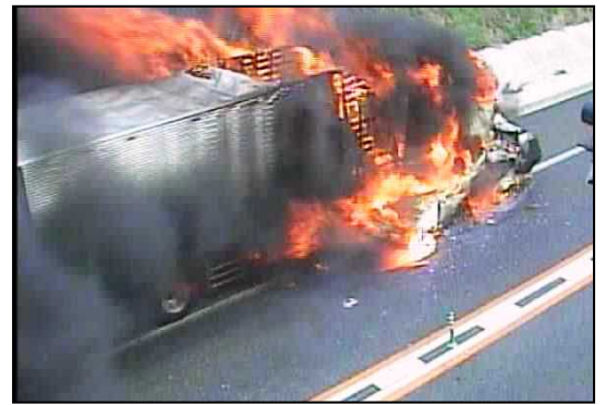
平成27年5月11日正面衝突事故