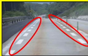
減速ドット区画線